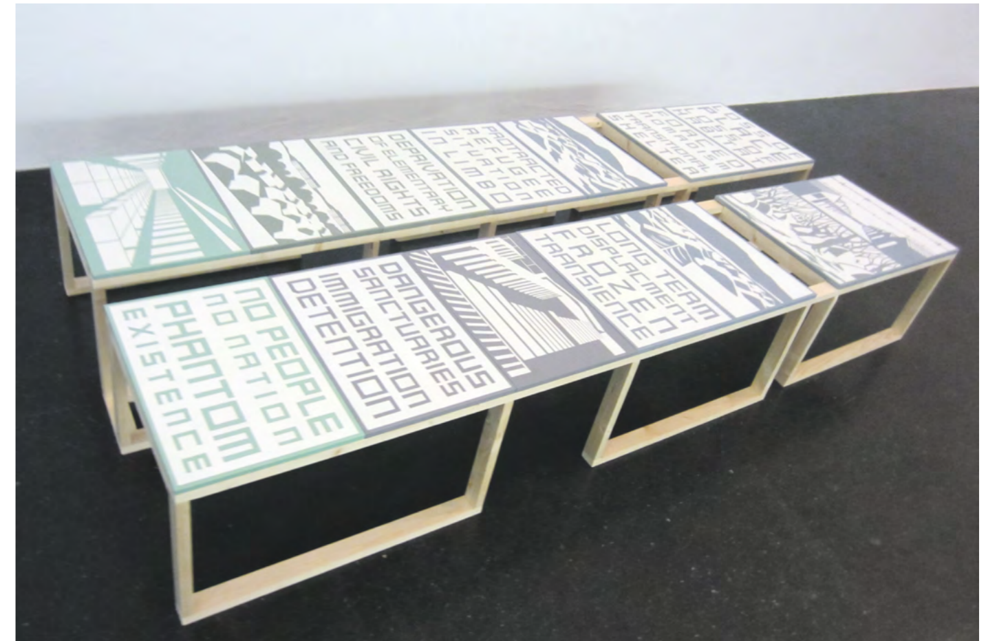
Andrea Ressi, CAMP – Structures of Exclusion (2016), Installationsansicht

In ihrer Arbeit verweist Ressi auf diese meist unsichtbar bleibenden Zonen des Verlusts: Verlust des Lebensraumes, Rechtsverlust, Freiheitsverlust, Unsicherheit etc. und stellt sie als Module des Ausnahmezustandes dar. In ihren Bild-Text-Objekten referiert sie auf Übersetzungs- bzw. Vereinfachungsstrukturen medialer Bildwelten und hebt die Sujets in ihrer Bedeutung auf die Ebene neuer globaler Piktogramme, die eine Welt des Umbruchs und globaler Migration widerspiegeln. Diese auf Strukturanalysen beruhende Bildsprache stellt eine visuelle Logik der Kontextualisierung dar, die, im Gegensatz zu den in den Medien oftmals praktizierten Vereinfachungstechniken, Zusammenhänge durch Abstraktion sichtbar macht.