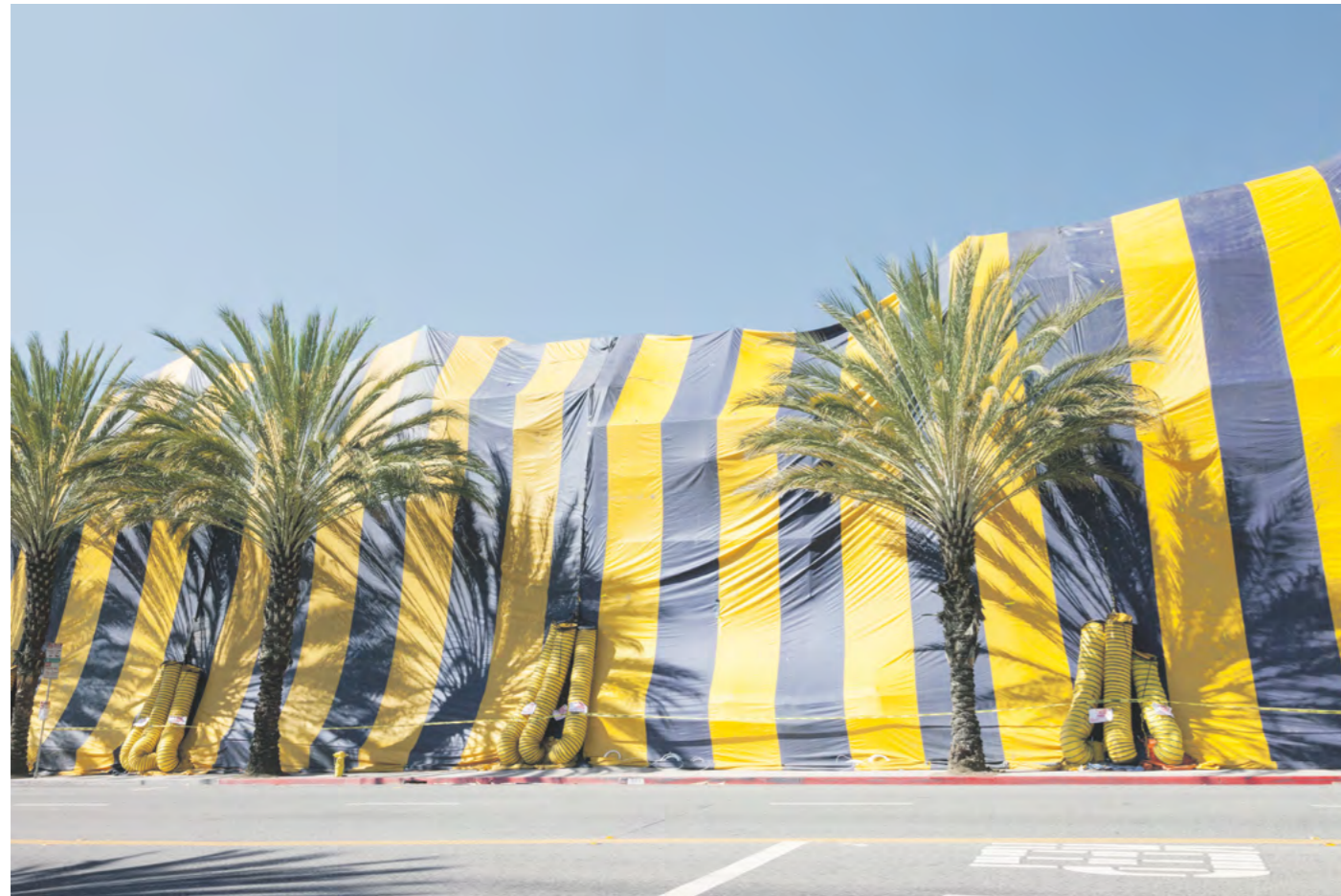
Lisa Truttmann, Tarpaulins (2017), Film, Still