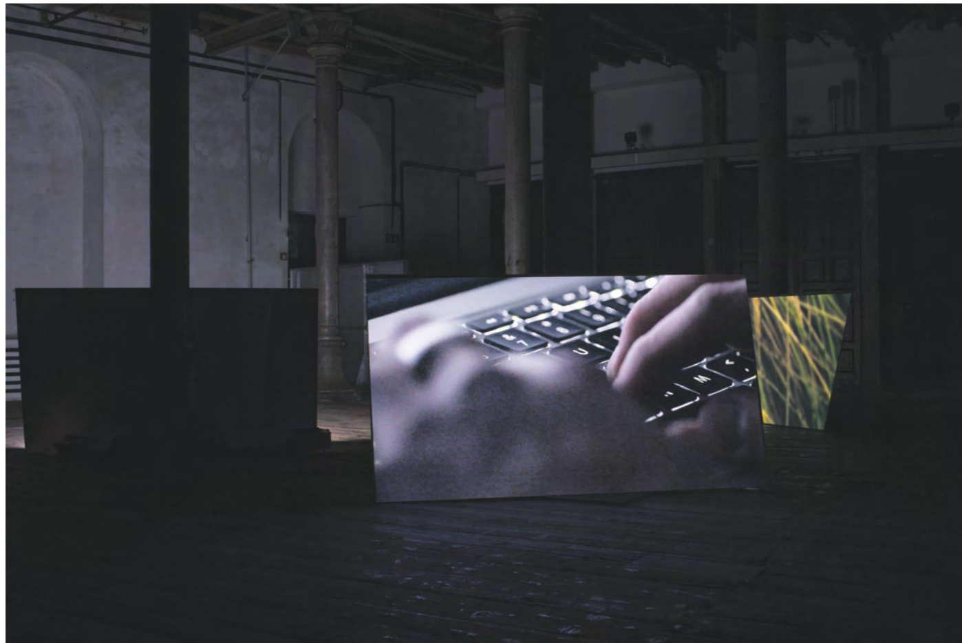
Marlene Maier, Food only exists on pictures (2017/2018), Mehrkanal-Videoinstallation, Installationsansicht